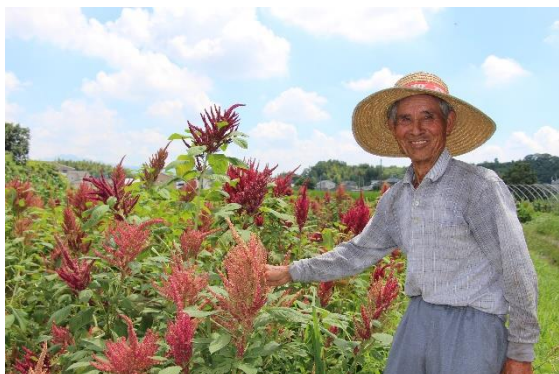
熊本県合志市の生産者

熊本県合志市と民間企業が一緒につくる太陽光発電所の収益の一部を使い、合志市の基幹産業である農業を長期的・多角的に進行していくプロジェクト。