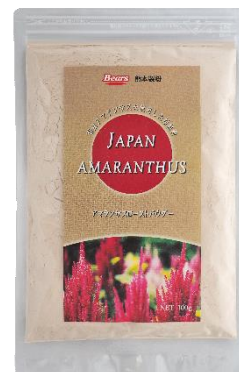
アマランサス ローストパウダー

熊本製粉では、地域に根差した総合粉体・食品素材メーカーとして、食の喜びと健康に貢献するために、熊本県合志市産のスーパーフード「アマランサス」を手軽に食べられるように商品開発しました。