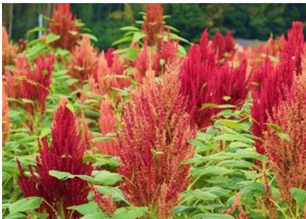
収穫前のアマランサスの花

販売サイト： https://bears.com/hpgen/HPB/entries/532.html