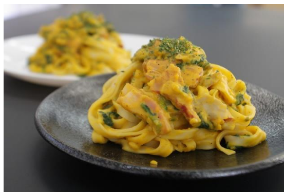
レシピ例 アマランサス入りクリームパスタ